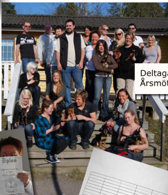
Deltagarna på Årsmötet 2009